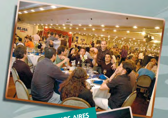
CIUDAD DE BUENOS AIRES