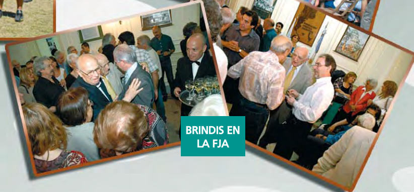
BRINDIS EN LA FJA