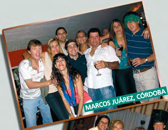
MARCOS JUÁREZ, CÓRDOBA

En fin, un nuevo aniversario que se cumple con la media sanción en Diputados a favor de paritarias para todos los judiciales, con nuestros gremios firmes en la CTA, en la Constituyente Social y en el Encuentro Nuestra América, militando en la primera fila fieles a los principios de la clase trabajadora. Todo eso, y tanto más, merecieron un brindis en cada rincón judicial, un brindis que ha sido más combustible porque el camino que tenemos que transitar no es corto, pero estará plagado, con seguridad, de nuevos logros.