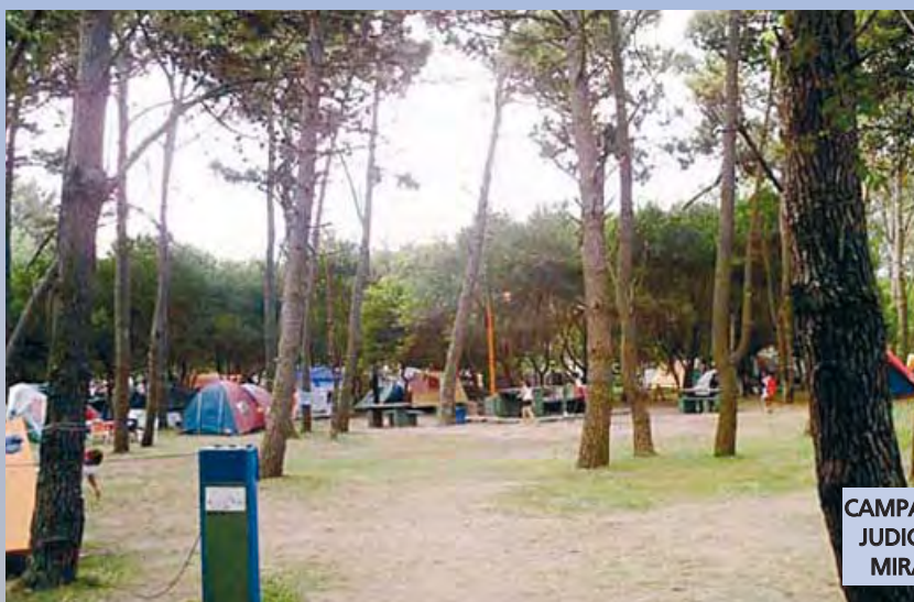
CAMPAMENTO JUDICIAL DE MIRAMAR