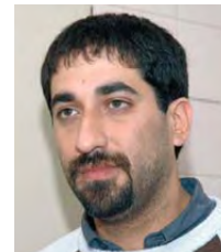
Por Matías Fachal, Secretario de Prensa de la FJA

U n año más que se va, un año más que se suma al calendario. Pero este no ha sido un año como cualquier otro para nuestro gremio. Es que el 2009 nos va dejando a los judiciales al borde de un triunfo incommensurable para lo que viene siendo nuestra reivindicación y bandera principal en todos estos últimos años. Ese gran paso hacia el triunfo que hemos dado es la media sanción de la Cámara de Diputados de la Nación a la Ley sobre Negociación Colectiva para nuestro sector. Es el derecho para los judiciales de todo el país a discutir paritarias.