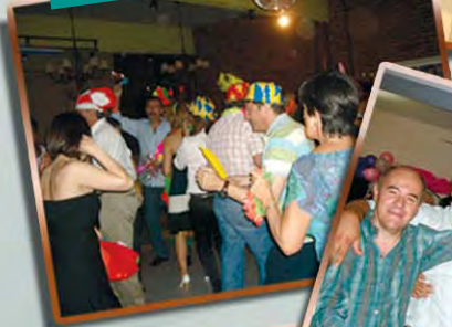
VILLA MARÍA, CÓRDOBA