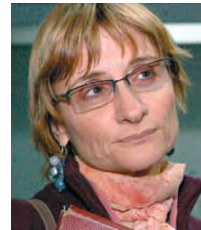
Por Irina Santesteban, Secretaria de DD. HH. de la FJA.

La Federación Judicial Argentina ha mantenido siempre en alto la bandera de la defensa irrestricta de los Derechos Humanos, en un país que se caracteriza por sistemáticas violaciones, en particular, desde las fuerzas de seguridad e instituciones carcelarias.