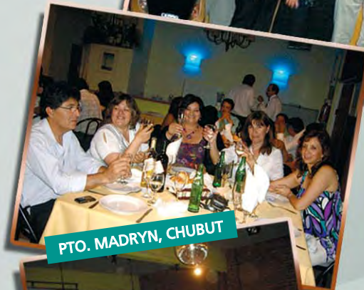
PTO. MADRYN, CHUBUT