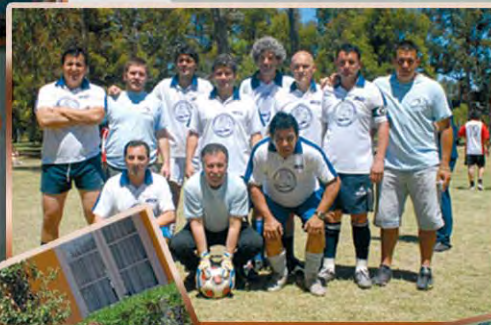
LOMAS DE ZAMORA