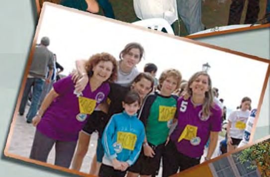
XIII OLIMPIADAS JUDICIALES PCIA. DE BS. AS.