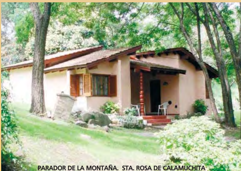
PARADOR DE LA MONTAÑA. STA. ROSA DE CALAMUCHITA

También se cuenta con un convenio con la empresa Turismo Cabal a partir del cual se puede acceder a otras operaciones turísticas a distintos puntos del país y a destinos internacionales.