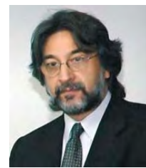
Por Ulises Gorini Asesor Jurídico de la FJA.

Más allá de esto, era y es indispensable que el Congreso de la Nación emita una señal ineludible en relación a garantizar la efectividad del derecho