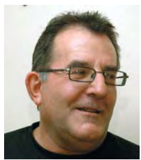
Por Rafael Rubio, Secretario de Relaciones Internacionales de la FJA

Los judiciales apostamos a la unidad de la clase trabajadora y la integración de los pueblos.